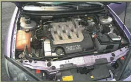
Die 170 PS des V6 reichen Nicole momentan noch aus

chen, entschied sich Nicole für eine No-Limit-Frontlippe mit entsprechendem Kühlergrill. Im Heckbereich kamen ebenfalls No-Limit-Teile wie die Schürze und der Heckdiffusor zum Einsatz. Soundtechnisch montierte sie einen offenen K&N-Luftfilter und begann sodann mit der Suche nach geeigneten Felgen. Die Jagd wurde durch ein schweres Unwetter jäh gestoppt. Hagelkörner, so groß wie Hühnereier, prasselten auf den Cougar nieder, und als der Wolkenbruch vorbei war, eröffnete sich Nicole das ganze Aus-