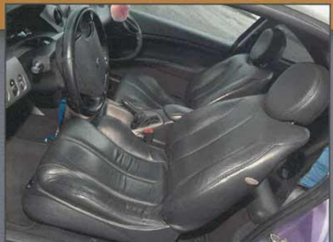
Lässt kaum Wünsche offen – die Vollausstattung ab Werk