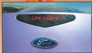
Wissen, was hier bremst...