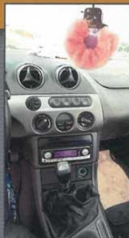
Grober Designfehler? – Handcuffs in Pink gehen gar nicht!

Motor: Reihenvierzylinder, 2544 ccm, K&N-57i-Luftfilterkit, 170 PS • Auspuff: Serie • Getriebe: 5-Gang-Getriebe (Serie) • Fahrwerk: Serie • Bremsen: Serie • Räder/Reifen: Schmidt "Space" in 8,5 x 17 mit Fulda "Extremo" in 225/40-17 (v) und 245/35-17 (h) • Karosserie: Radläufe hinten 3 cm gezogen, No-Limit-Frontlippe, -Kühlergrill, -Heckschürze und -Diffusor, Lack: Lila metallic (Lackiererei Reustle in Löchgau) • Interieur: Leder-Vollausstattung, Frontscheibe mit Keil, JVC-Radio, Kenwood-4-Kanal-Verstärker (500 Watt), Kofferraumausbau in lila Plüsch