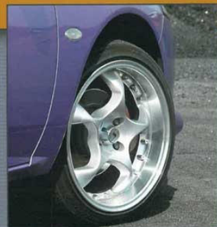
Schmidt "Space" in 17 Zoll unterstreichen den kräftigen Antritt