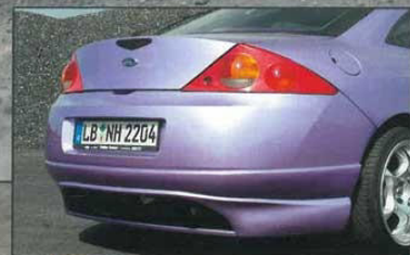
Den Diffusor für die Heckschürze lieferte No Limit